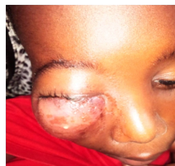
Figure V: Cellulite futilisée d'origine dentaire