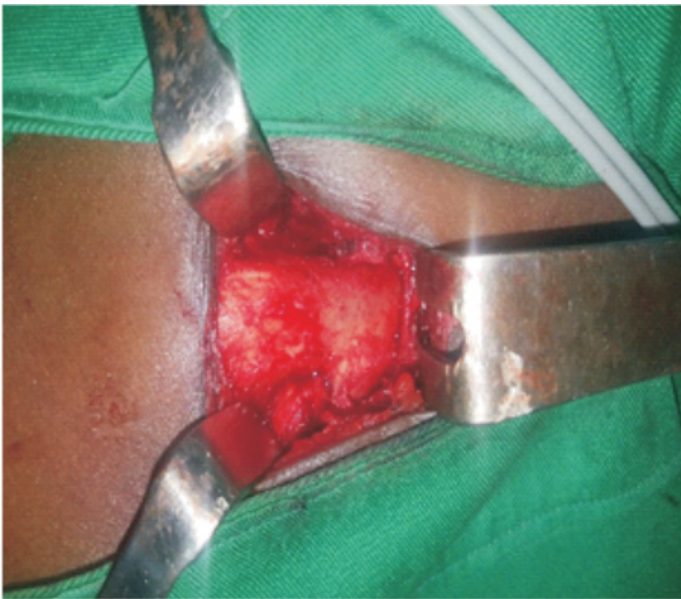
Photo n°5 : Exposition de l'épine iliaque antéro-supérieure gauche